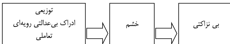
شکل ۱- مدل مفهومی رابطه‌ی ادراک بی‌عدالتی سازمانی با خشم و بی‌نزاکتی در محیط کار

بر این مبنای، مدل مفهومی پژوهش حاضر همان‌گونه که در شکل ۱ مشاهده می‌شود طراحی و فرضیه پژوهش به شرح زیر تدوین گردید: طی یک سلسله روابط زنجیره‌ای بین ادراک بی‌عدالت سازمانی (توزیعی، رویه‌ای و تعاملی) با خشم و بی‌نزاکتی در محیط کار رابطه‌ی معنادار وجود دارد.