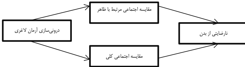
شکل ۱. الگوی پیشنهادی پژوهش حاضر

به‌عنوان میانجی رابطه بین درونی‌سازی آرمان لاغری و نارضایتی از بدن در دانشجویان دختر مورد بررسی قرار گرفت. شکل ۱ الگوی پیشنهادی پژوهش حاضر را نشان می‌دهد.