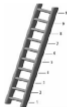
شکل 2. نردبان مک‌آرتور

ه) مقیاس مک‌آرتور: مقیاس مک‌آرتو توسط روان‌شناس سلامت نانسی آدلر و همکاران در سال 2000 طراحی شد. مقیاس مک‌آرتور یک مقیاس ذهنی طبقه اجتماعی است که ادراک فرد را از جایگاه نسبی خودش در جامعه نسبت به دیگران ارزیابی می‌کند. آدلر در این مقیاس از یک نردبان با ده پله استفاده کرده است (شکل 2). در این مقیاس برای شرکت‌کنندگان توضیح می‌دهند که نردبان جایگاه افراد را در جامعه نشان می‌دهد. در بالای نردبان افرادی قرار دارند که بیشترین پول، بیشترین تحصیلات و بهترین شغل را دارند. در پایین نردبان افرادی که کمترین پول، کمترین تحصیلات و بدترین شغل (مشاغلی که احترام کمتری دارند) یا بدون شغل هستند قرار دارند و سپس از شرکت‌کنندگان خواسته می‌شود تا جایگاه نسبی خود را نسبت به دیگران در این نردبان با زدن علامت X مشخص کنند.